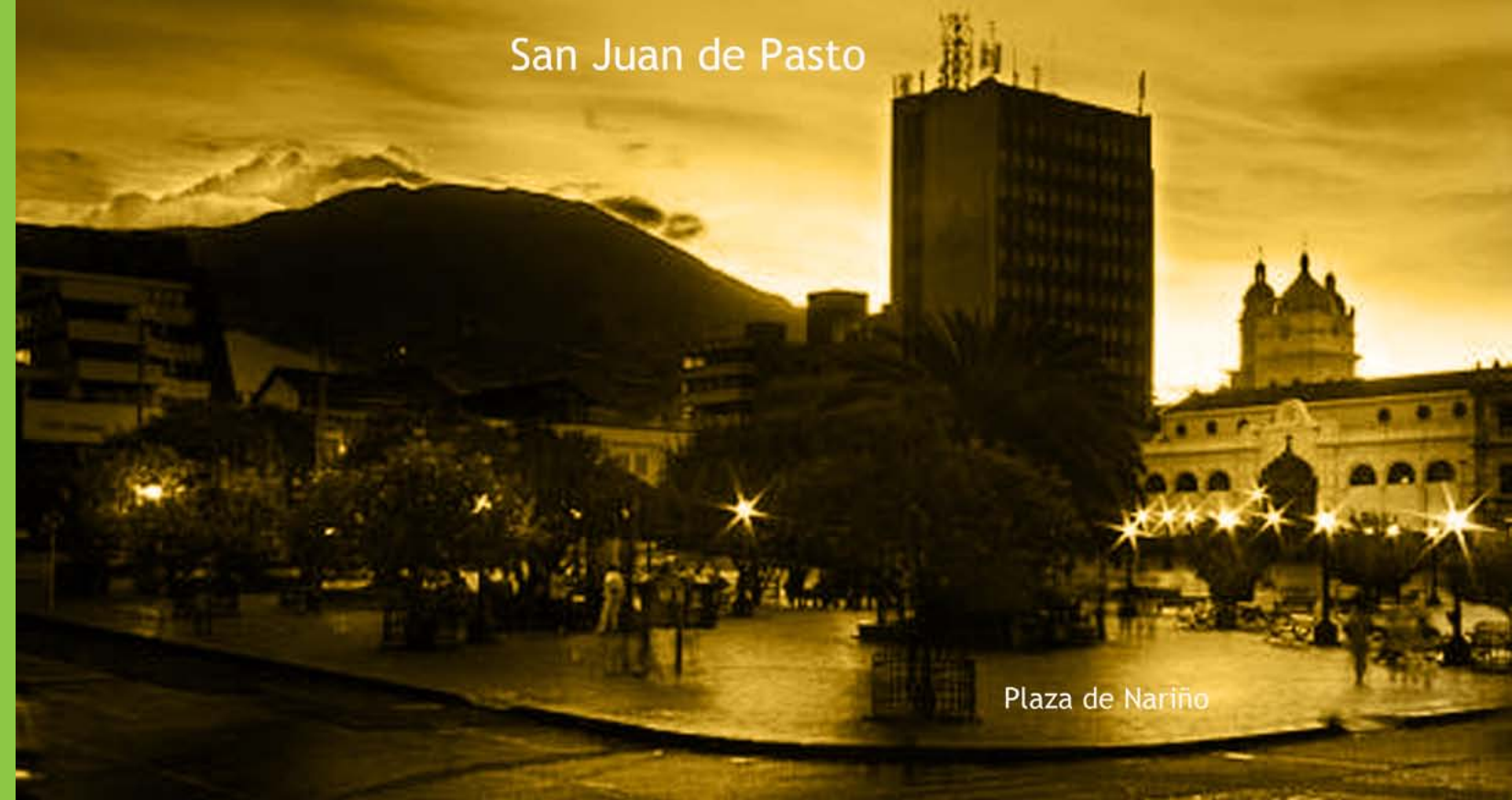
Plaza de Nariño