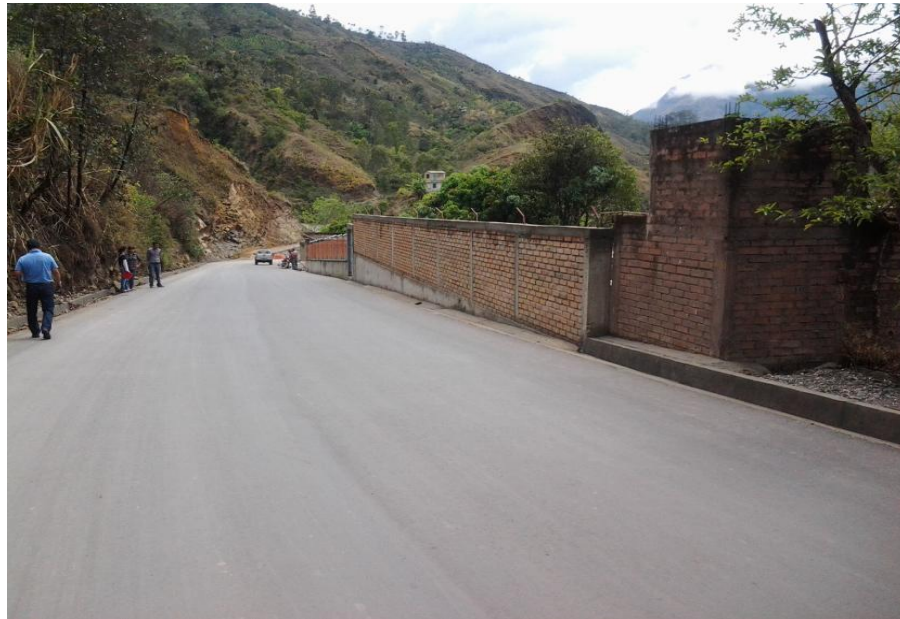
Pavimentación en asfalto y obras de restitución Sector San Pablo