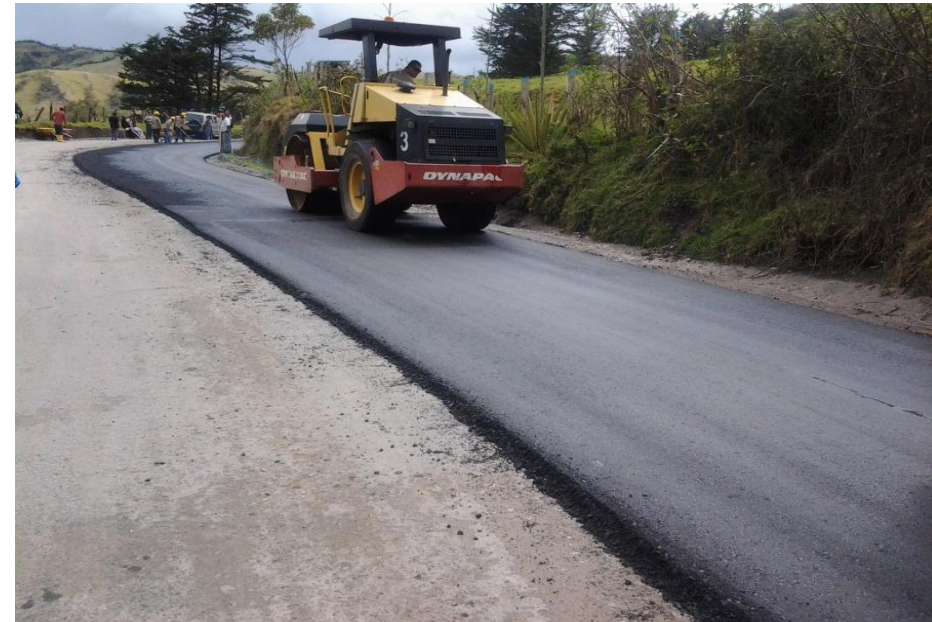
Trabajo de pavimentación en asfalto - Sector a Cruz