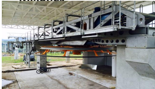
Teleférico: $5,517 Millones