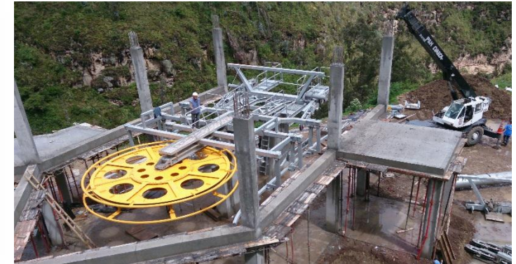
Cimentaciones y obras (Fontur): $2,409 Millones

TOTAL PROYECTO: $14.049.676.000. $1.508.988.000.