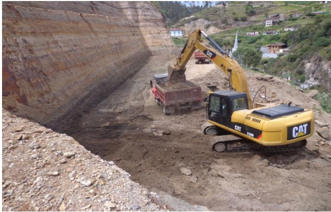
Maquinaria: $1068 Millones