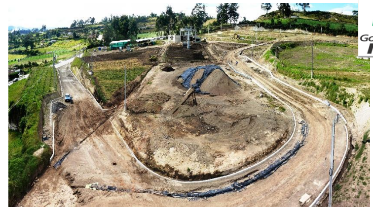
Terrenos y Servidumbres: $884 Millones