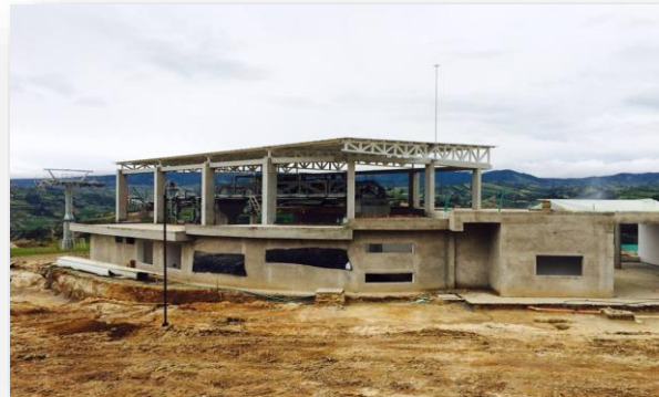
Obras Civiles: $1,606 Millones