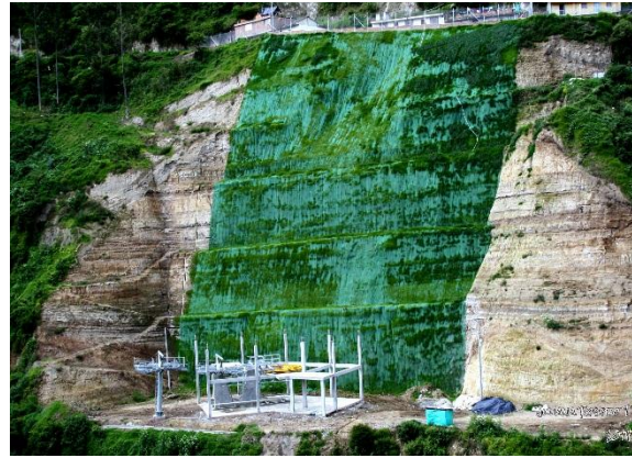
Taludes y caminos: $847 Millones